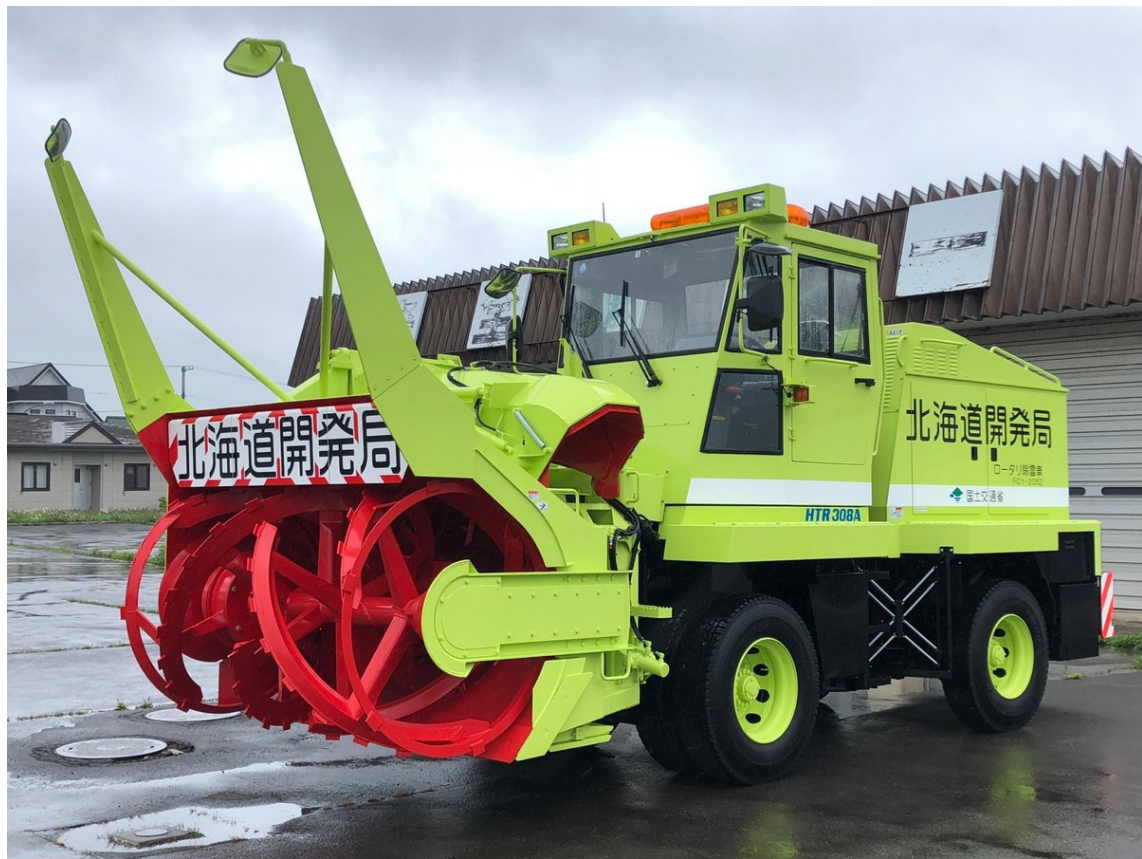
北海道開発局 黄緑色の除雪車