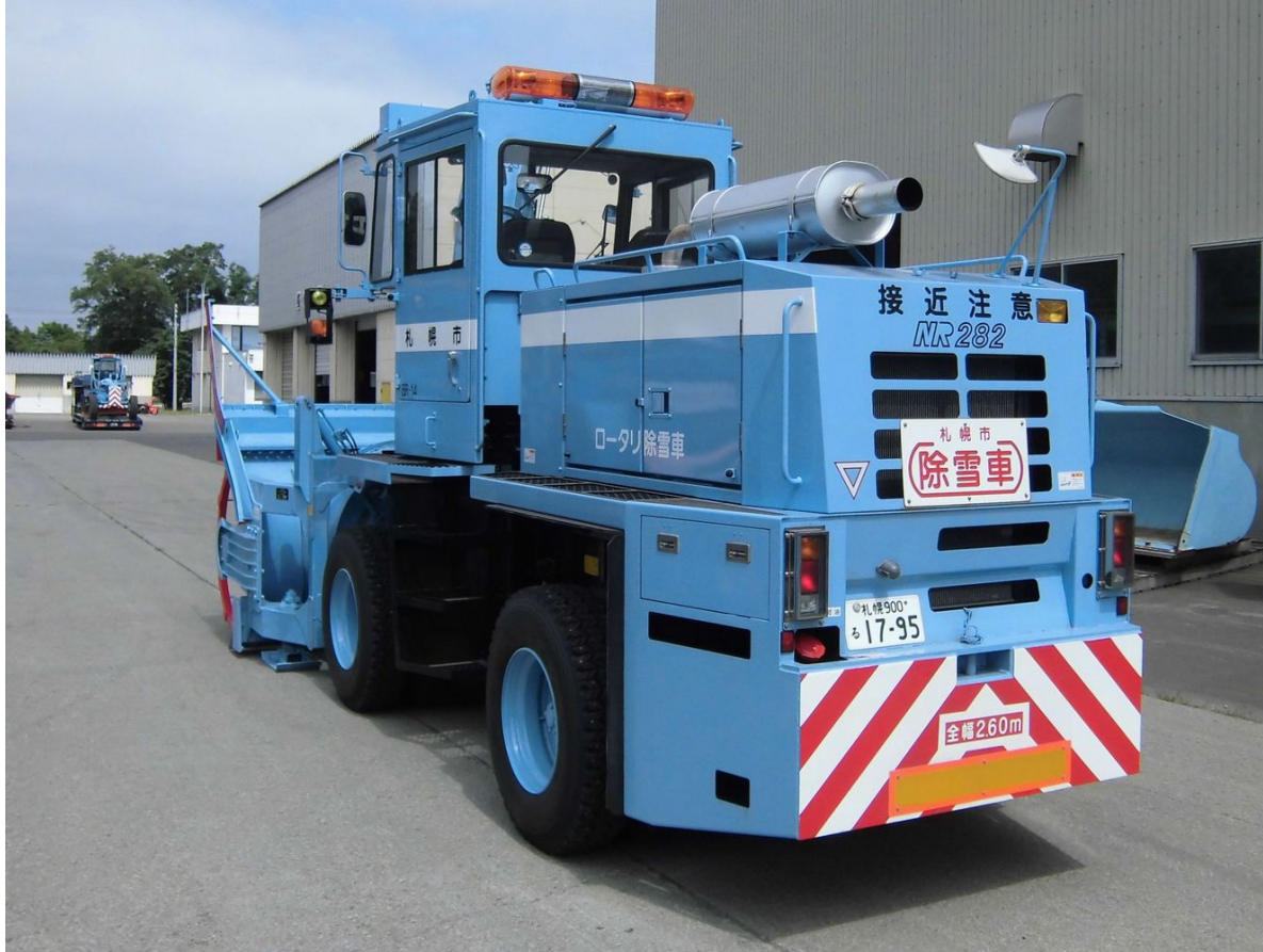
札幌市 青色の除雪車