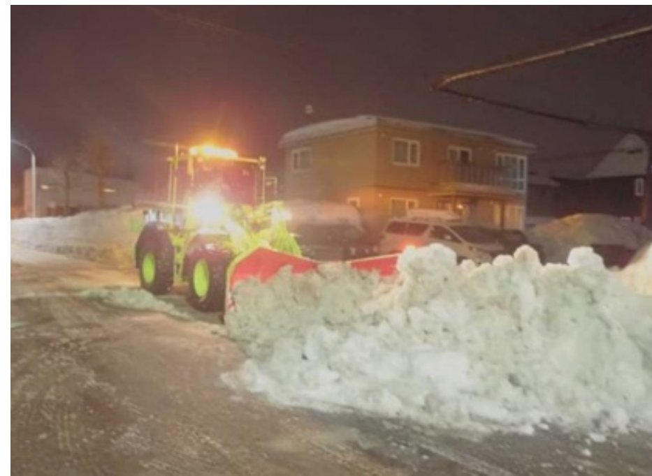
恵庭市の市道除雪のようす（令和3年）