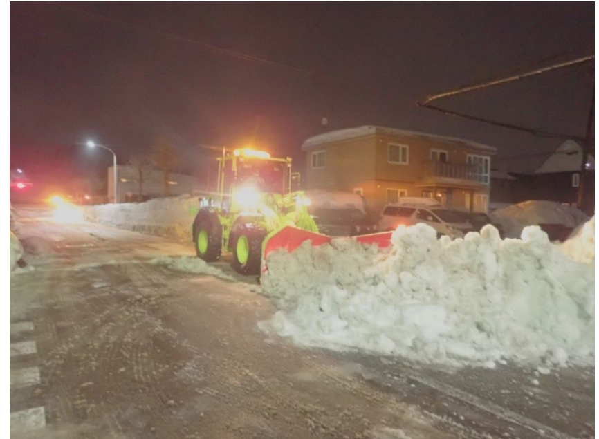
恵庭市の市道除雪のようす（令和3年）