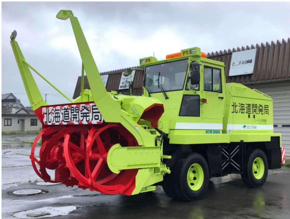
北海道開発局 黄緑色の除雪車